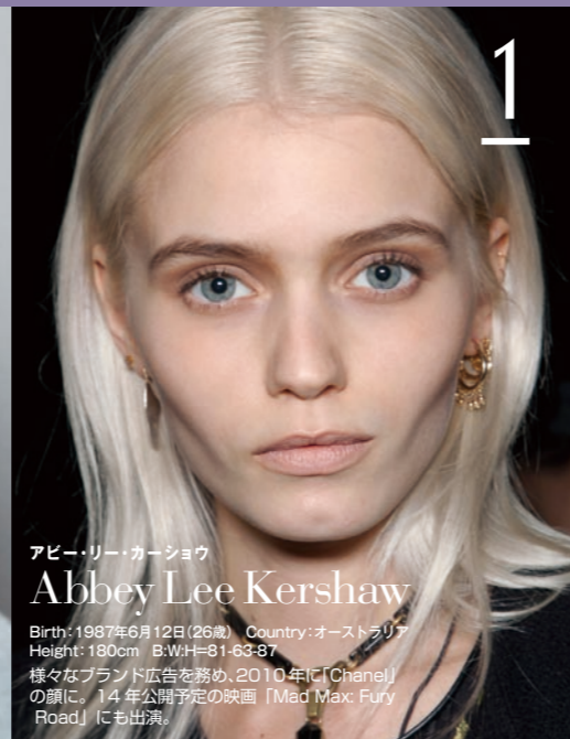
アビー・リー・カーショウ Abbey Lee Kershaw

Birth: 1989年3月22日(24歳) Country: ブラジル Height: 179cm B:W:H=81-61-86 2006年春夏コレクションでデビュー。09年のランウェイで一躍人気に。地元ブラジルを拠点に活躍。男性的な雰囲気魅力。