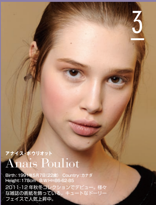
アナイス・ポウリオット Anais Pouliot

Birth: 1991年5月7日(22歳) Country: カナダ Height: 178cm B:W:H=86-62-85 2011-12年秋冬コレクションでデビュー。様々な雑誌の表紙を飾っている。キュートなドリーリーフェイスで人気上昇中。