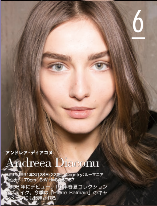
アンドレア・ディアコヌ Andreea Diaconu

Birth: 1987年6月12日(26歳) Country: オーストラリア Height: 180cm B:W:H=81-63-87 様々なブランド広告を務め、2010年に「Chanel」の顔に。14年公開予定の映画「Mad Max: Fury Road」にも出演。