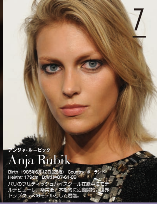
アンジャ・ルービック Anja Rubik

Birth: 1990年7月29日(23歳) Country: ロシア Height: 177cm B:W:H=82-59-88 2007年に仏のモデル事務所と契約し、毎年ショーに出演している常連。2013年秋冬の「Mango」のカタログにも登場している。